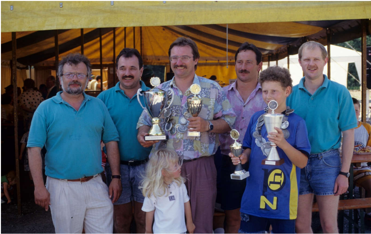
Foto mit den geehrten Fischerkönigen 1998